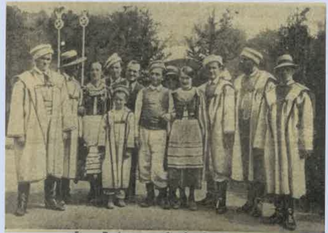
Grupa Pogórze w Gorlicach w strojach ludowych – zdjęcia z artykułów Adama Wójcika z 1938 roku

Strój męski Pogórze: koszula z lnianego płótna pąceśnego na święto, a ze zgrzebnego na dzień powszedni, ze stryflami lub przyrębkami, zmarszczona pod szyją, z kołnierzykiem wąskim stojącym lub częściej z kołnierzem szerokim wykładanym. Koszula z reguły popuszczona po wierzch białych spodni,