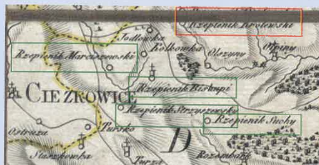
Mapa z 1797 r.

Na pewno wiemy, iż na obecnych mapach, planach oraz portalach internetowych widnieją cztery Rzepienniki: Marciszewski, Strzyżewski, Biskupi i Suchy. Czy jednak zawsze tak było? Co stanie się, jeżeli cofniemy się o dziesiątki lat wstecz i spojrzymy uważnie na archiwalne mapy? Sprawdźmy to. Tutaj sytuacja wygląda zupełnie inaczej, gdyż w zależności od roku mapy, w jakim została wydana, można ujrzeć