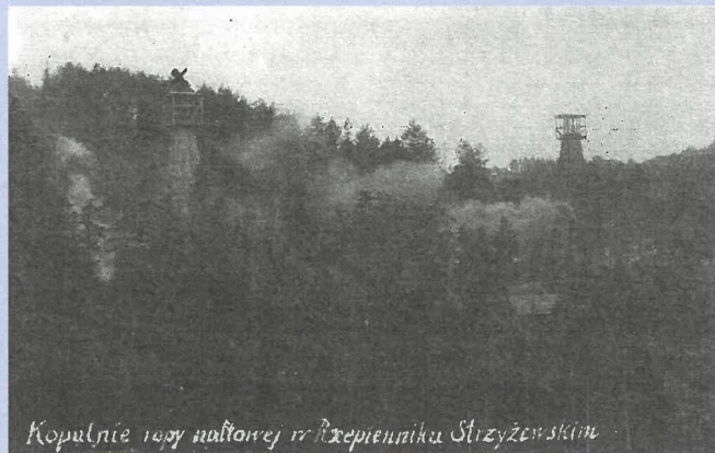
Kopalnia ropy naftowej w Rzepienniku Strzyżewskim

Po zakończeniu wojny, kopalnie dalej funkcjonowały. Nie prowadzono jednak nowych odwiertów, lecz zajmowano się eksploatacją dotychczasowo wykopanych szybów. Ponieważ wydobywanie ropy naftowej w roku 1945 zatrzymało się na