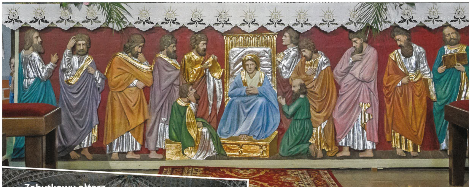
Zabytkowy ołtarz w Kościele pw. Wniebowzięcia NMP w Rzepienniku Biskupim po renowacji