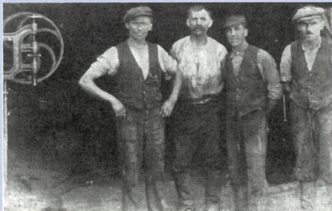
Rzepiennik Strzyżewski. Robotnicy w kopalni ropy. Lata 30. XX w.