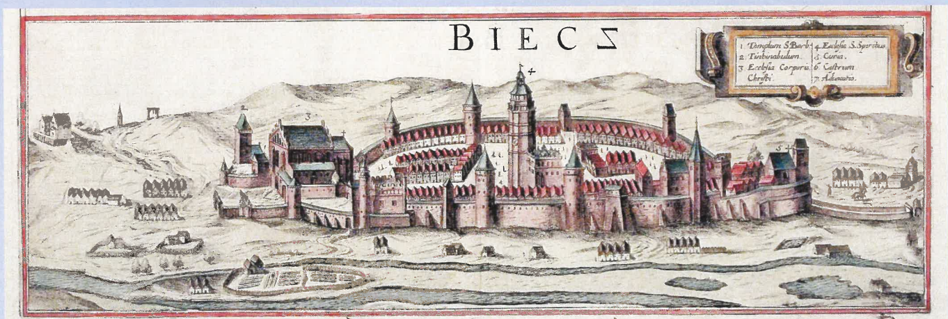
Rycina z dzieła Georga Brauna i Franza Hogenberga z widokiem Biecza z 1617 r.

W XV wieku doszło do sporu o przymus drożny między Bieczem a Nowym Sączem, a także Ciężkowicami o przewóz towarów z Bardejowa i okolic. Władze bardejowskie, które