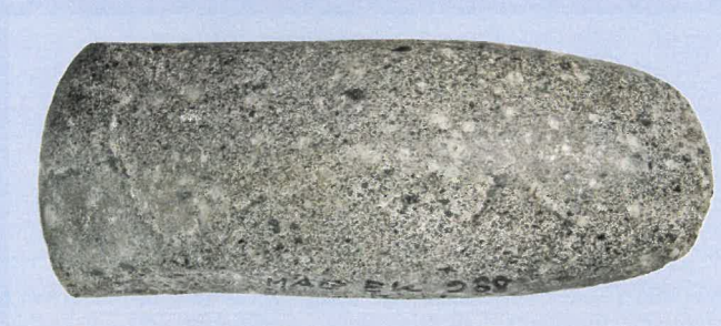
Kamienna siekierka* – zdjęcie to przykładowa fotografia kamiennej siekierki ze zbiorów Muzeum Archeologicznego w Gdańsku