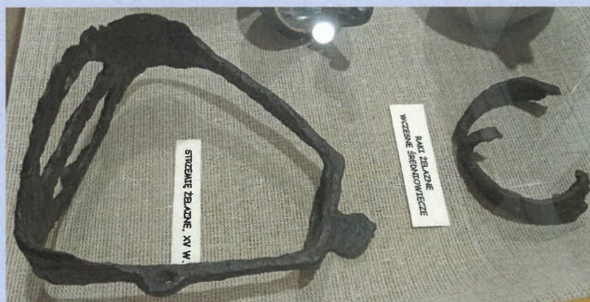
Fragment rycerskiego ekwipunku – strzemię i raki

Opis: raki żelazne (znalezisko jw.) wczesne średniowiecze. Owalne w zarysie. Zachowany kolec środkowy i jeden boczny; obręcz płaska w przekroju. Niewielkie uszkodzenie