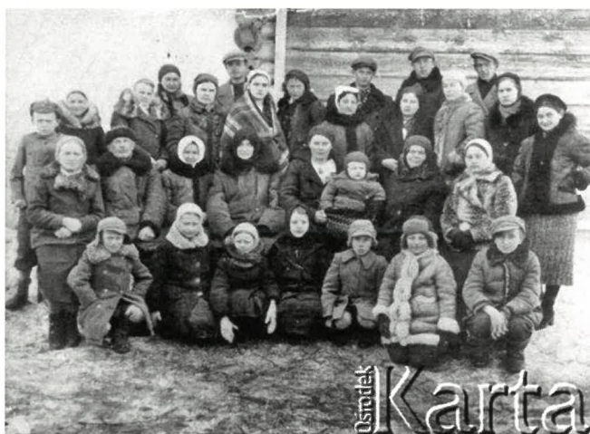
Bannowka, Kazachstan, ZSRR 1940/1941 r. Polacy deportowani 13 kwietnia 1940 z Nadwórnej (woj. stanisławowskie)

ZSRR po 17 września 1939 roku. Liczne choroby, przemęczenie, głód i brutalne traktowanie przez funkcjonariuszy NKWD przyczyniły się do śmierci wielu osób. Z uwagi na to, że dużą część deportowanych stanowiły kobiety i dzieci, znaczna liczba osieroconych dziewcząt i chłopców trafiła do polskich domów dziecka organizowanych na terenie Kazachstanu w latach 1941–1942, albo do sowieckich domów dziecka. W 1942 roku nielicznym Polakom udało się dołączyć do formującej się armii generała Władysława Andersa i opuścić Związek Radziecki. Pozostali nigdy już nie powrócili do swojej Ojczyzny. Dzieci i wnuki Polaków, którzy urodzili się na terenie Kazachstanu, były sowiezowane, zabroniono im nauki języka polskiego oraz pielęgnowania tradycji narodowych. Stworzenie człowieka sowieckiego było priorytetem polityki ZSRR. Mój artykuł niech będzie wyrazem pamięci o tysiącach, którzy wciąż czekają na powrót do Polski. Nie możemy zapomnieć o tej kolejnej tragicznej karcie naszej historii. Państwo polskie ma obowiązek pomagać w powrocie z Kazachstanu potomkom niewinnych zesłańców do kraju przodków.