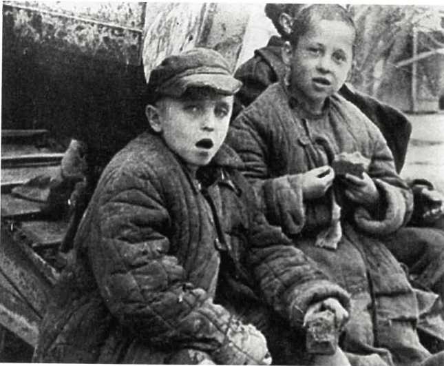
Polskie dzieci; mali zesłańcy w Związku Radzieckim