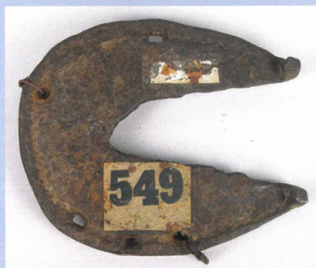
Podkova tatarska znaleziona w Olszynie

Źródło informacji: Teka Grona Konserwatorów Galicyi Zachodniej, t. I, s. 281, korespondencja z dyrekcją i pracownikami Muzeum w Krakowie.