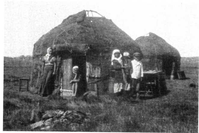
Polska rodzina zesłańców na stepie w Kazachstanie

Szacuje się, że po podpisaniu przez II Rzeczypospolitą traktatu ryskiego w 1921 roku, który kończył wojnę z bolszewicką Rosją i ustalał granicę wschodnią; na obszarach ZSRR pozostało wielu Polaków. Mimo prób pomocy w umożliwieniu repatriacji podejmowanych przez państwo polskie na terenach na wschód od granicy ustalonej w Rydze według różnych szacunków pozostało od 1,2 do 2 mln. Polaków. Władze polskie szacowały liczbę pozostałych Polaków na 1,5 mln. Historia wywozek naszych rodaków w bezkresne stepy Kazachstanu zaczęła się w latach 30. XX wieku.