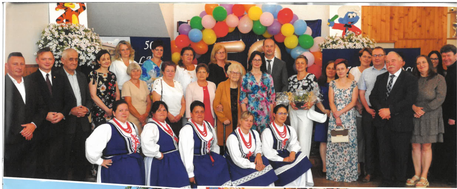
50 lat Przedszkola Publicznego w Turzy