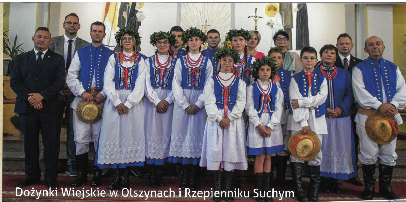
Dożynki Wiejskie w Olszynach i Rzepienniku Suchym